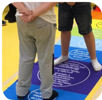
Friedensteppich groß 4,36 x 78 m inkl. 19% Ust. € 130