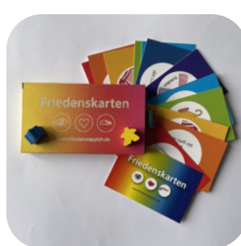
Friedenskarten mit Symbolen inkl. 19% Ust. € 17