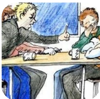
Eskalationsstufen für Kids inkl. 19% Ust. € 40