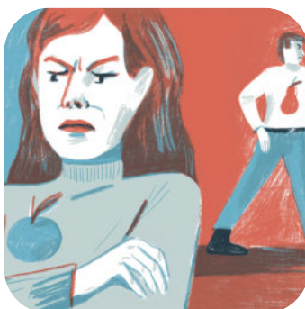
Eskalationsstufen für Erwachsene inkl. 19% Ust. € 40