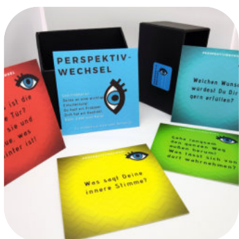
Coachingkarten Perspektiv-Wechsel inkl. 19% Ust. € 25