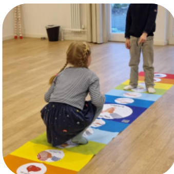
Friedensteppich klein 3,00 x 55 cm inkl. 19% Ust. € 100