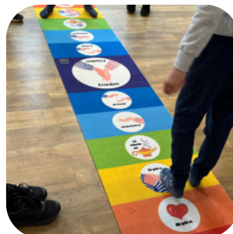
Friedensteppich klein in Teppichqualität 3,00 x 55 inkl. 19% Ust. € 160